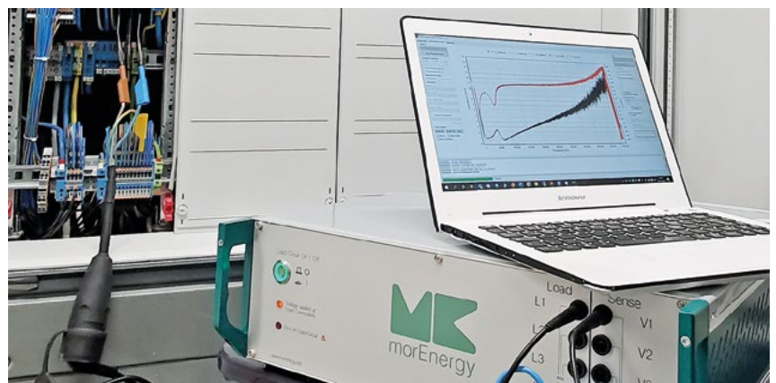
Bild 1. Messung und Datenanalyse der bestehenden Power-Quality

Kommt es darüber hinaus zu unterschiedlichen Oberschwingungen in den verschiedenen Phasen des Netzes, kann diese Unsymmetrie zu einem